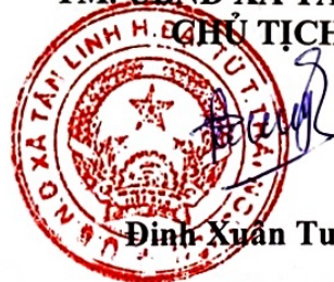
Đinh Xuân Tuyền