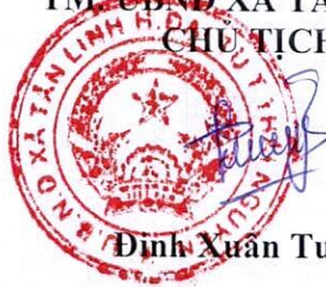
Đinh Xuân Tuyền