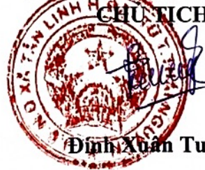
Đinh Xuân Tuyền