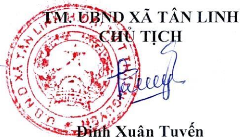
Đinh Xuân Tuyền